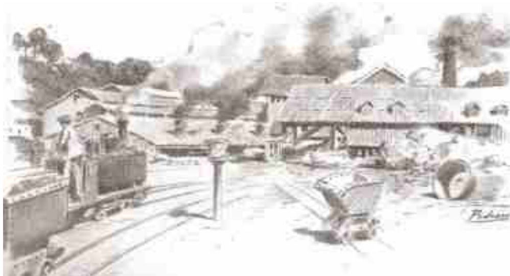
Dibujo de las instalaciones de Minas de Cartes, insertado en el semanario La Esfera, año 1916

El servicio interior de 800 ml de trazado en vía de 0,75 ml, estuvo servido mediante tracción vapor. En las instalaciones de Minas de Cartes ubicadas en Cantabria, explotadas por “Heinz & Correa”, la línea discurría entre Minas de Cartes y Reocín. Disponía de ramales de 500 mm de ancho para el servicio interior de las minas.