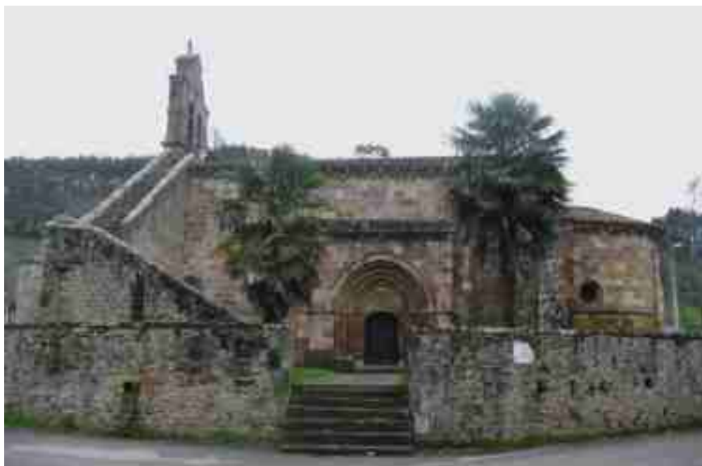
Iglesia Románica de Santa María de Yermo (Cartes)