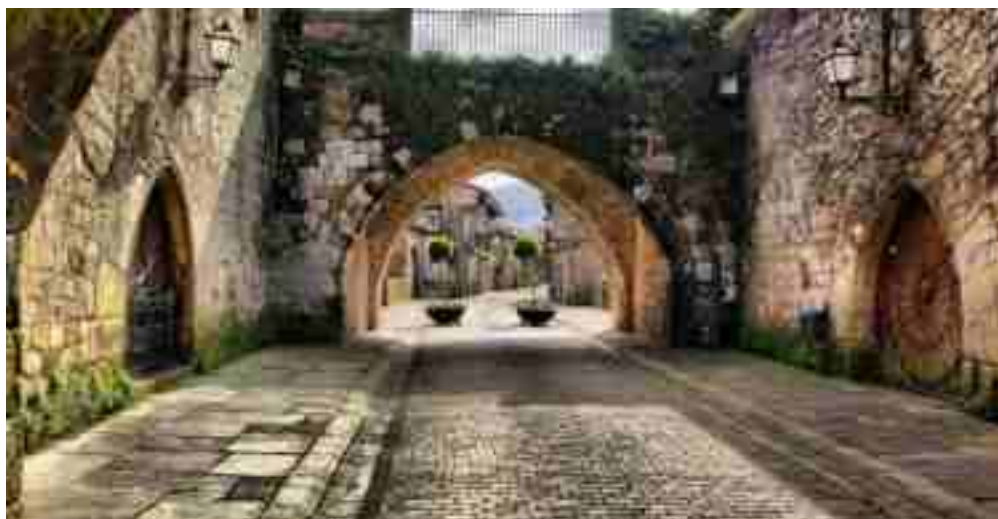
Torreones de Cartes