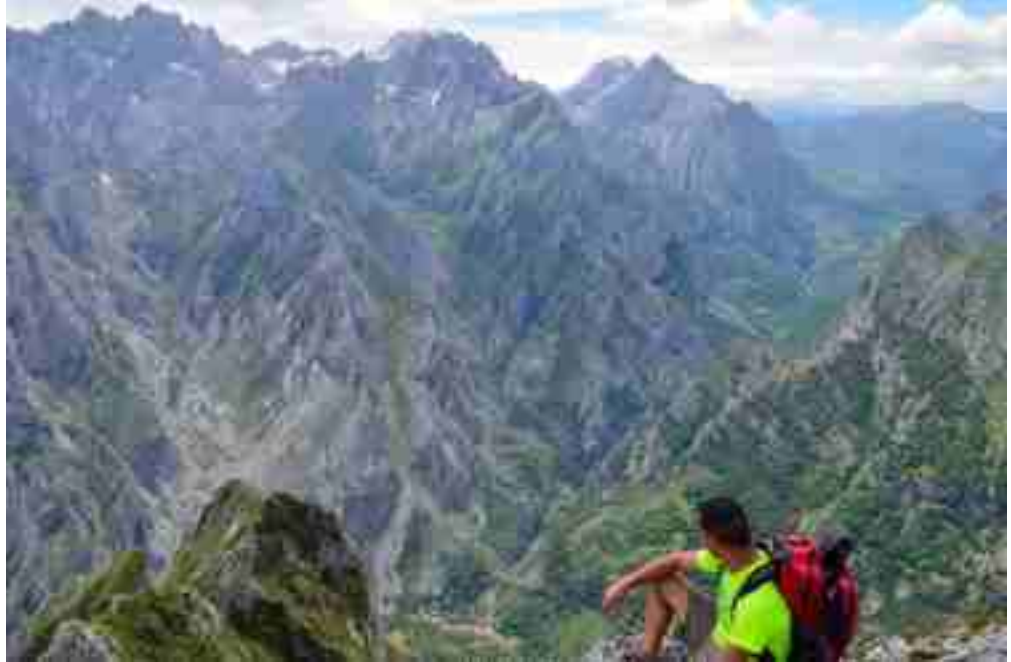
El Macizo Central y Caín desde El Jultayu

Ascender a la cima del Jultayu es una actividad a la que un buen aficionado a los deportes de montaña no puede sustraerse, la bella panorámica que desde la cima se observa de los abismos del Cares y las impresionantes vistas del Macizo Central de los Picos de Europa bien merecen la pena y resultan inolvidables.