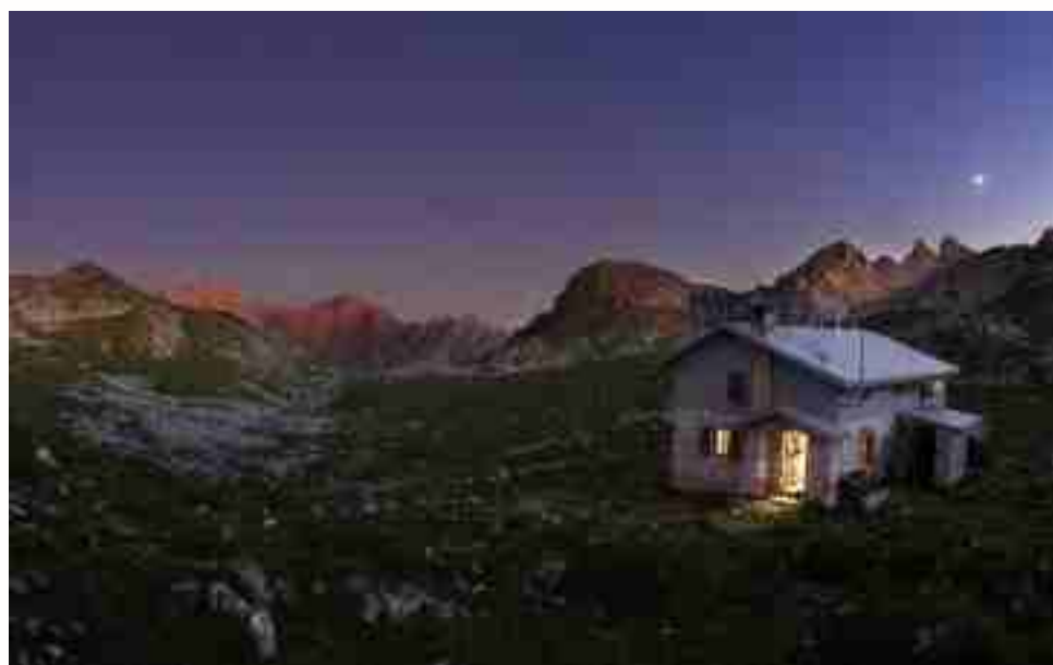
Refugio de la Vega de Ario, "dormir en el cielo, según Desnivel"