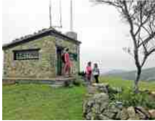
Cabaña de Zarceillo