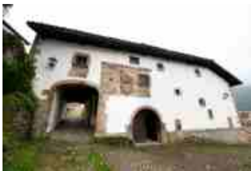
La Casona de Tudanca

En Tudanca tengo vacas / en La Lastra las ovejas / en Santotís las albarcas / lindas palas en Sarceda , escribía José María de Cossío en sus Rutas Literarias por la Montaña , bien pudiera ser la letra de una bonita tonada para acompañar el inicio de nuestra andanza.