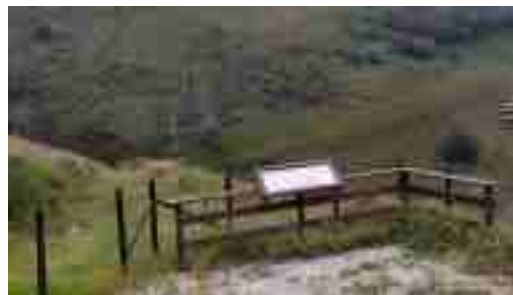
Corral de los lobos, Selores

Desde Renedo a Selores / siguiendo la carretera / en el pueblo de Sopeña / tengo yo a mi morena....al parecer tampoco falta alegría hoy entre los que desde Zarceillo han optado por bajar por la Canal de Caborzal a Selores contemplando los restos de una de las escasas mangas que se conservan en la región, de las que antaño se levantaban para capturar lobos, por aquí llamada El Corral del Lobo .