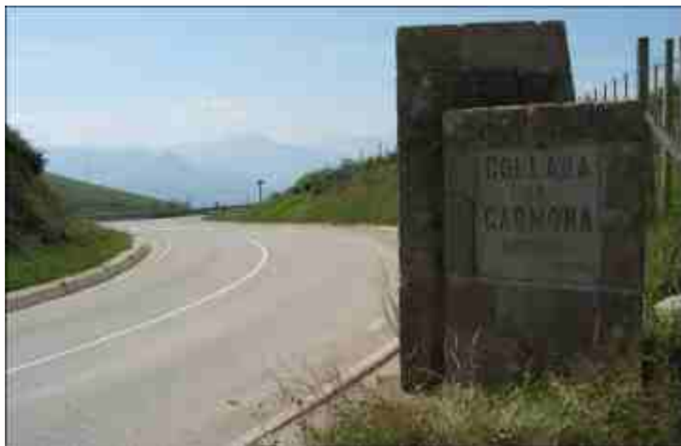
La Collá de Carmona