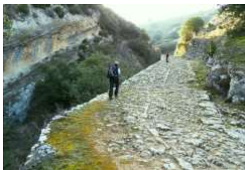
La Calzada de El Almiñé