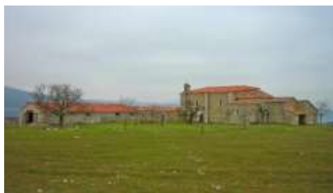
Nuestra Señora de la Hoz y Casa de las Lanás

Tudanca de Ebro ha sido a lo largo de la historia un pueblo sumamente pobre, aislado entre enormes farallones rocosos y con escasas tierras de cultivo, la vida de sus habitantes estuvo siempre vinculada al río Ebro. En sus aguas los vecinos pescaban truchas, barbos...con la técnica del esparavel, para surtir a los pueblos de la zona. Otra labor tradicional de las gentes de Tudanca consistía en comprar buenos jatos en la feria de Soncillo, muchos de ellos tudancos de Cantabria, que bien enseñados para el trabajo en las diferentes labores del campo, eran vendidos con importantes beneficios.