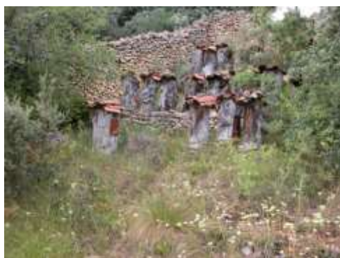
Colmenar en Ahedo del Butrón

Junto al arte, la vida misma. La vida de quienes dejaron la huella de sus quehaceres diarios, los molineros, los ganaderos, los carreteros o los apicultores cuando se llamaban colmeneros.