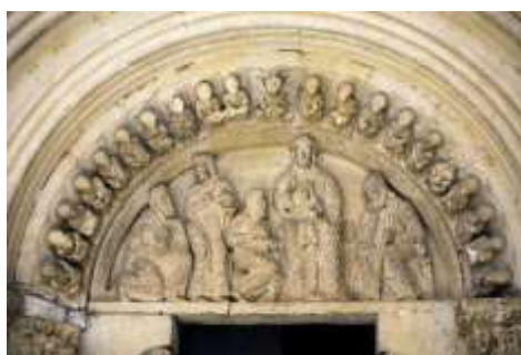
Tímpano de Ahedo del Butrón