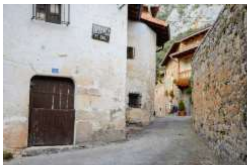
Tudanca de Ebro

Tudanca de Ebro ha sido a lo largo de la historia un pueblo sumamente pobre, aislado entre enormes farallones rocosos y con escasas tierras de cultivo, la vida de sus habitantes estuvo siempre vinculada al río Ebro. En sus aguas los vecinos pescaban truchas, barbos...con la técnica del esparavel, para surtir a los pueblos de la zona. Otra labor tradicional de las gentes de Tudanca consistía en comprar buenos jatos en la feria de Soncillo, muchos de ellos tudancos de Cantabria, que bien enseñados para el trabajo en las diferentes labores del campo, eran vendidos con importantes beneficios.