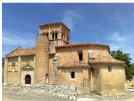
Iglesia románica de San Nicolás en El Almiñé

Tanto el inicio como el final están junto al Ebro, Puente Arenas y Tudanca, quizá lo único que tengan en común ambos pueblos. Y por medio, un paisaje emocionante.